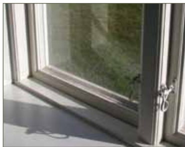
Her et ældre vindue med en koblet ramme med energiglas.

Nye vinduer hvor der bruges aluminium i rammerne leder kulden ind ved kanterne. Hvis et ældre vindue i kernetræ forsynes med en forsatsdel, som fx en koblet ramme med energiglas, så opnås der mindre varmetab og større lydisolering end typiske nye vinduer.