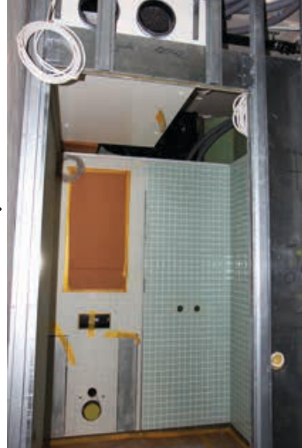
Det præfabrikerede bad med plads til ventilation øverst.

Du kan se frem til at følge den fortsatte renovering i kommende numre.