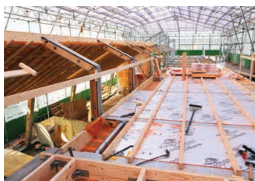
Her fornemmes konturerne af tagterrasserne og lejlighedernes tagkonstruktion.