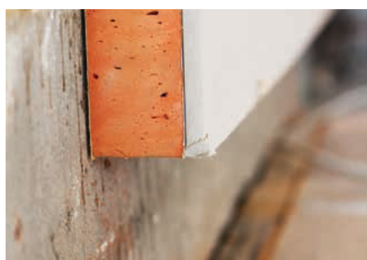
Den indvendige isolering blottes en åbning nederst. Dermed opfugtes bjælkeenderne ikke og man undgår råd.