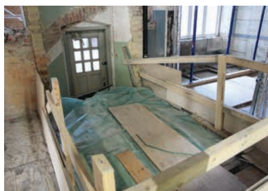
Her ses området, hvor bagtrappen var placeret.